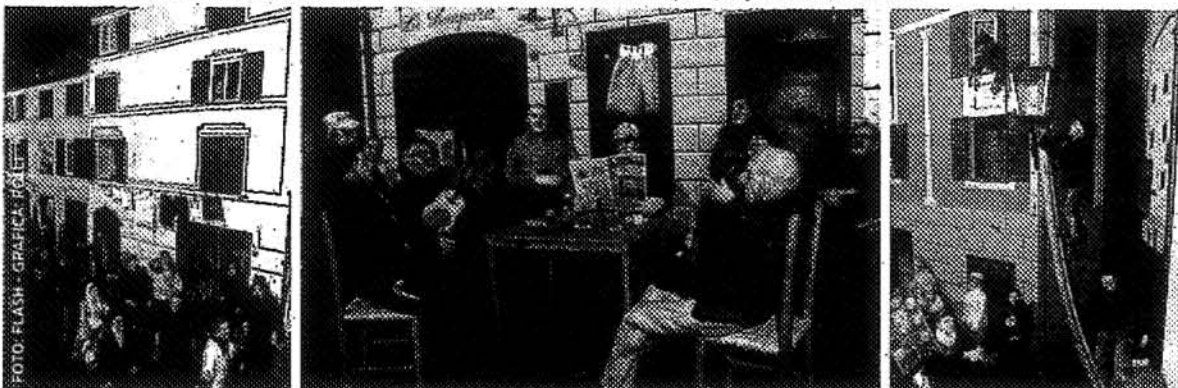
Altre tre vedute dell'allestimento nei Giardino della Torre del Borgo